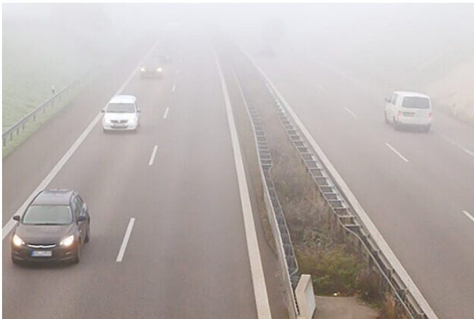
Gebieden van het beeld die wazig lijken